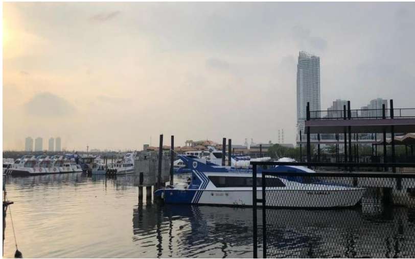
Gambar 5. Kapal Dinas Perhubungan

Fasilitas transportasi umum menuju pelabuhan juga masih minim, wisatawan yang membawa kendaraan pribadi sering kali kesulitan menemukan tempat parkir karena lahan parkir yang terbatas. Cuaca ekstrem juga berpotensi memengaruhi jadwal keberangkatan kapal, bahkan hingga pembatalan, yang dapat berdampak pada minat wisatawan untuk berkunjung ke Kepulauan Seribu melalui dermaga Kali Adem. Di samping itu, banyak penumpang yang belum sepenuhnya mematuhi peraturan di atas kapal, seperti merokok dan membuang sampah ke laut, yang tidak hanya membahayakan keselamatan diri mereka sendiri tetapi juga kenyamanan dan keselamatan penumpang lain.