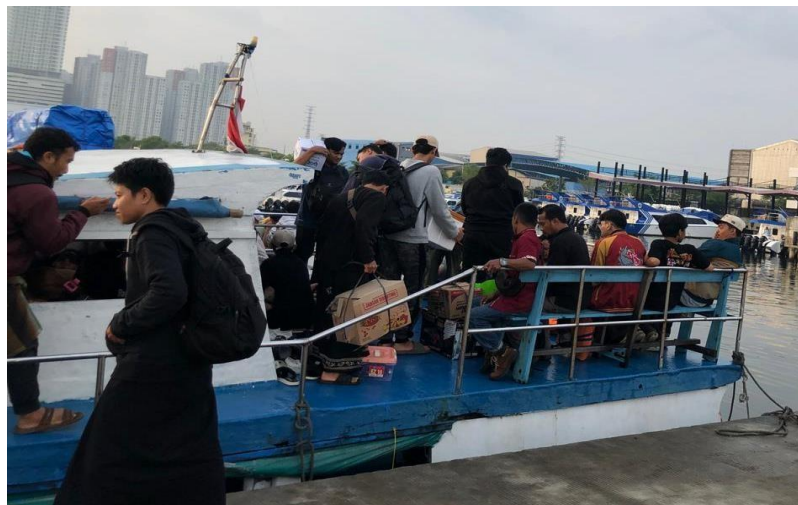
Gambar 6. Kapal Tradisional