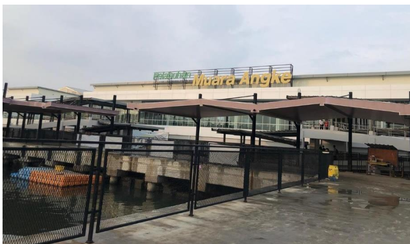
Gambar 4. Dermaga Keberangkatan dan Kepulangan Penumpang

Hasil dari penghitungan yang ada di atas menunjukkan bahwa “Strategi pemasaran Pulau Pari Kepulauan Seribu melalui pembangunan infrastruktur laut yang berkualitas di Dermaga Kali Adem Muara Angke” berada pada titik koordinat 1 dimana kuadran ini memiliki posisi kompetitif yang kuat dengan pasar yang sedang berkembang pesat. Dapat dikatakan bahwa “Strategi pemasaran Pulau Pari Kepulauan Seribu melalui pembangunan infrastruktur laut yang berkualitas di Dermaga Kali Adem Muara Angke” berada di posisi yang Posisi Pasar yang Kuat serta Strategi Pertumbuhan Pasar yang Kuat (Lucidity, n.d.).