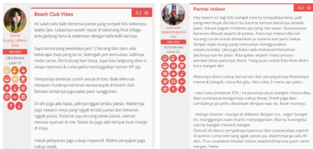
Gambar 2. Review Konsumen Hey Beach