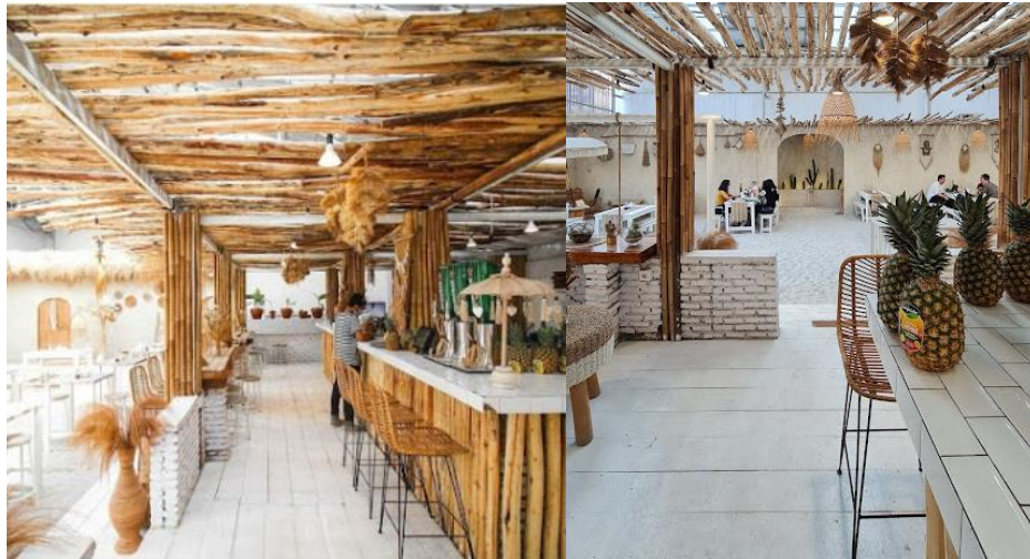
Gambar 1. Desain interior Hey Beach Pluit

Restoran Hey Beach terletak di Jl. Pluit Permai No. 23, Pluit, Penjaringan, Jakarta Utara. Restoran Hey Beach secara umum menjual makanan dengan cita rasa Western dengan mengikuti konsep ala Bali. Secara tidak langsung konsumen yang berkunjung di Hey Beach dengan disuguhkan suasana desain interior ala daerah khas Bali membuat pengalaman makan tak sekedar memuaskan kebutuhan pangan tetapi juga kebutuhan rekreasi yang terasa seperti di Bali. Hal ini yang menjadi keunikan yang ditawarkan oleh Hey Beach . Berikut gambar penampakan desain interior dan beberapa review konsumen terkait desain tersebut: